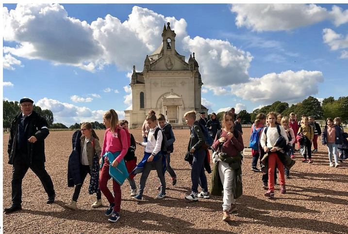
Une classe de CM1 en visite guidée à la nécropole

Les 4.000 Gardes d'Honneur de Lorette s'apprêtent à vivre de grands moments en cette fin d'année. D'abord avec la visite du président Macron, le 8 novembre, ensuite avec la traditionnelle veillée du 10 Novembre qui prendra cette année une dimension particulière.