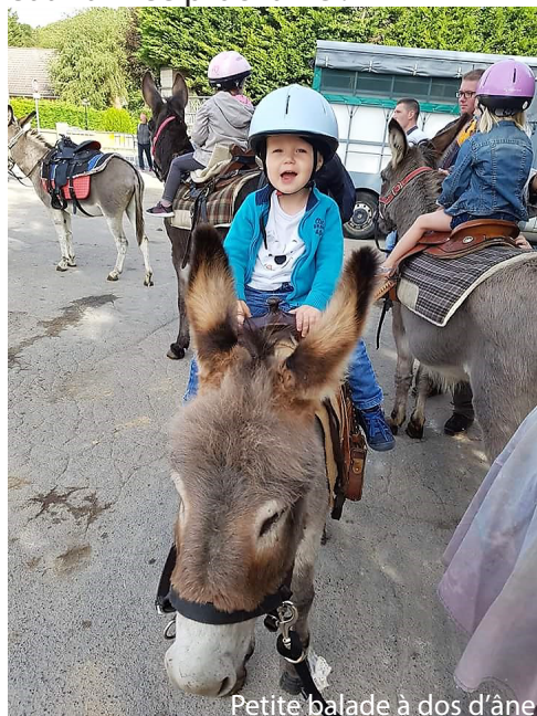
Petite balade à dos d'âne

Un grand merci à tous les fidèles et à l'année prochaine !