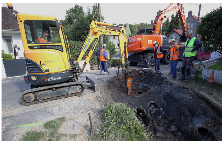
Travaux de réfection du pont du 8 Mai.

Des cadres en béton de 3 mètres de long sur 1,82 mètre de large, sur lesquels est posée la route, ont donc été installés pour remplacer les deux tuyaux (cf schéma ci-dessous). Le débit devrait ainsi être multiplié par cinq, empêchant la rivière de déborder sur la route.