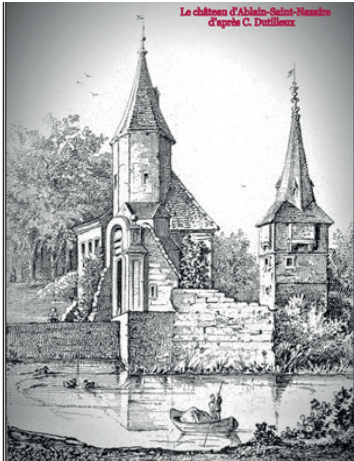
Le château d'Ablain-Saint-Nazaire d'après C. Dutilleul

Au fil des témoignages, on peut constater l'évolution de ce château d'abord féodal puis modifié à la Renaissance.