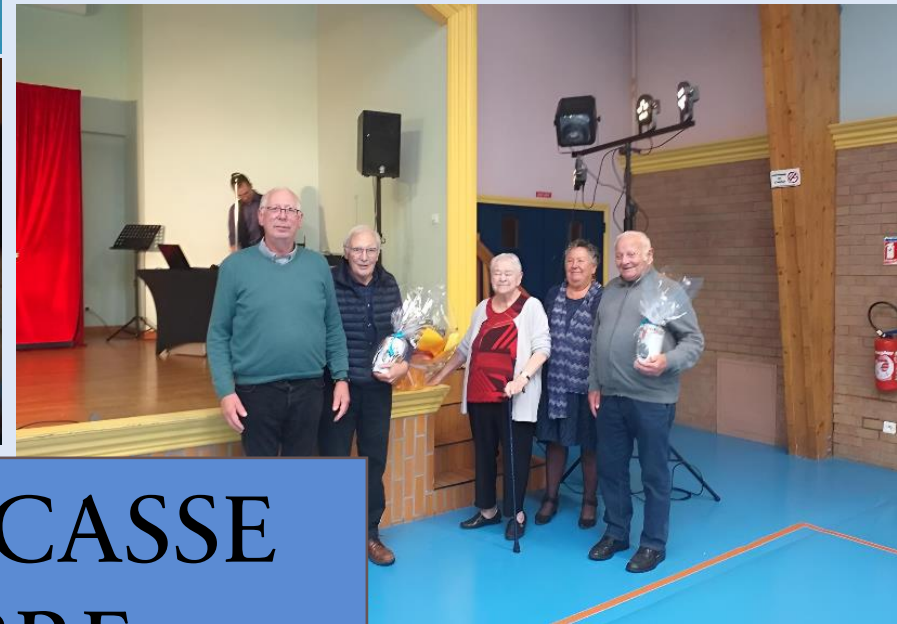
GOÛTER DUCASSE 14 OCTOBRE