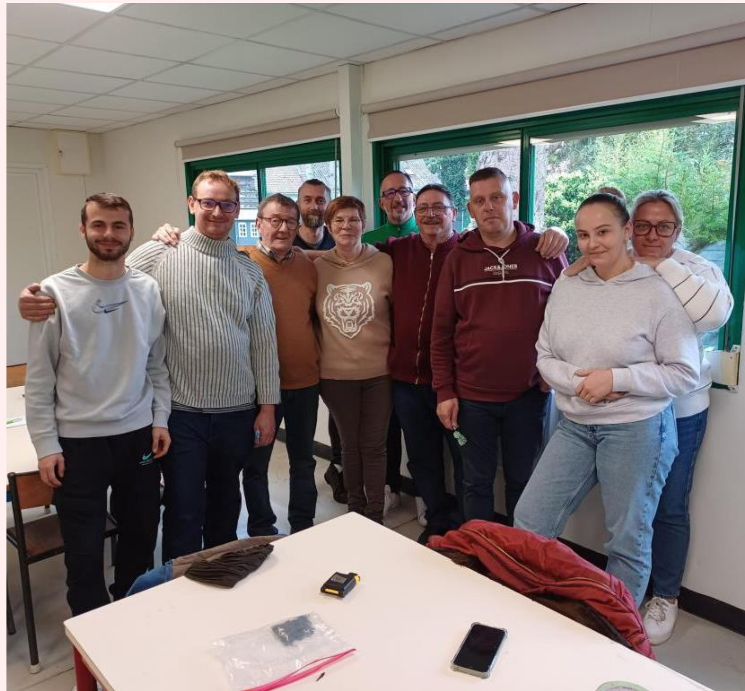
JOURNÉE PORTE OUVERTE PÉTANQUE ABLAINOISE 12 NOVEMBRE