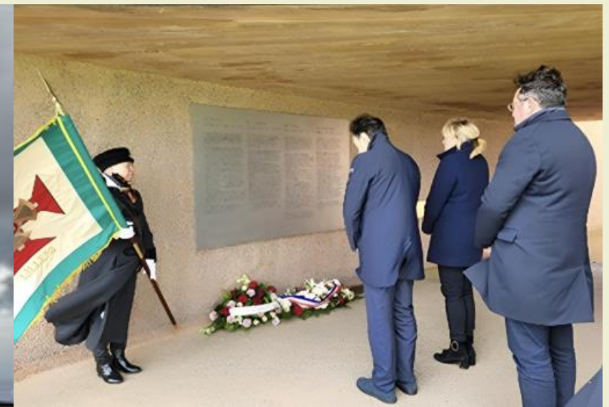
L'AMBASSADEUR ET LE CONSUL DU PORTUGAL À L'ANNEAU DE LA MÉMOIRE AVRIL 2024