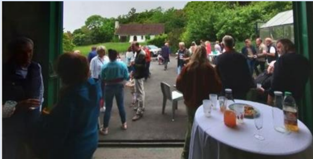
FÊTE DES VOISINS 17 MAI ET 7 JUIN