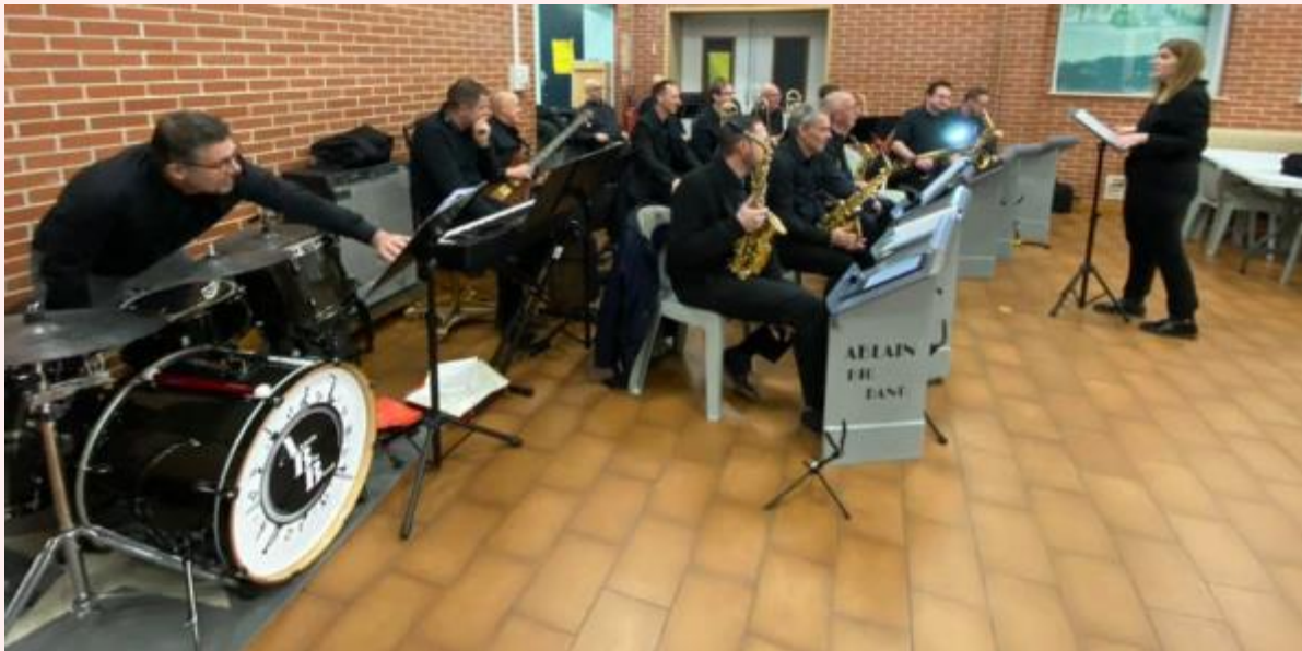
BEAUJOLAIS NOUVEAU 21 NOVEMBRE