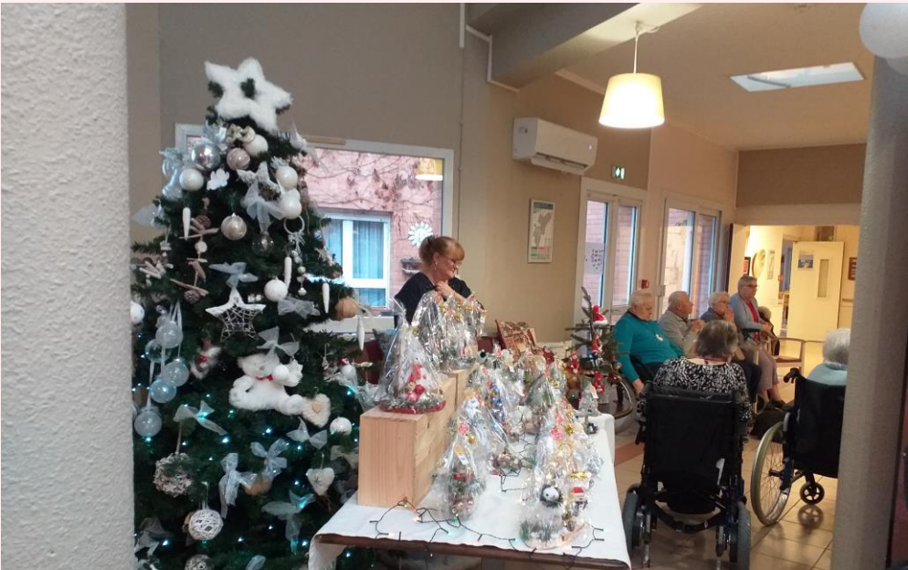
MARCHÉ DE NOËL À L'EHPAD 13 DÉCEMBRE